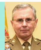
General Dacoba Director Instituto Español de Estudios Estratégicos