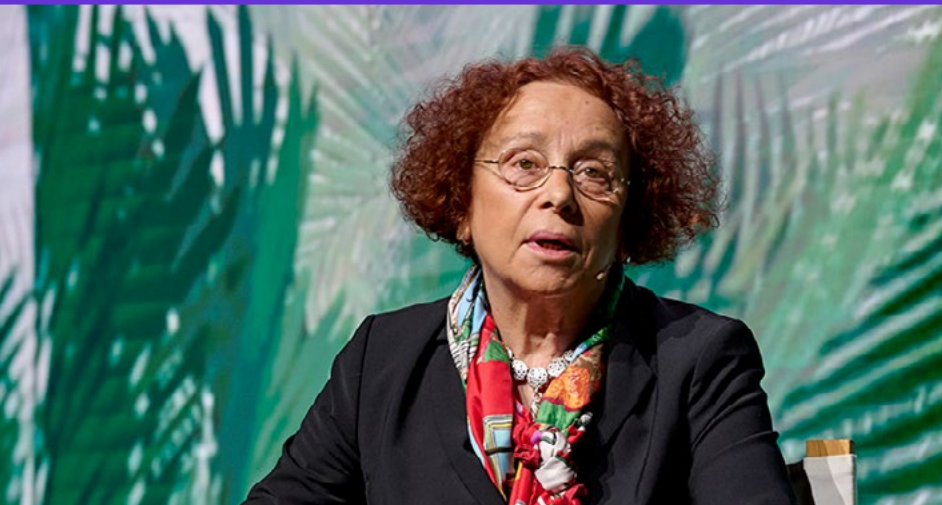
Ana Palacio Ex ministra de Asuntos Exteriores.

“Estamos en un momento de mutación del orden internacional, que fue construido sobre una arquitectura de normas e instituciones y que ahora está en momento de cambio”, dijo. La exministra nos habló de China, de los retos de las democracias liberales, del sistema global, de la importancia de las normas, de la visión de Europa, del reto de la ampliación de la UE, de los desafíos migratorios, de la transición energética y sostenible, de la necesidad de una reindustrialización de Europa.... De todos esos hilos complejos y fácilmente quebradizos que integran la malla del orden geopolítico mundial.