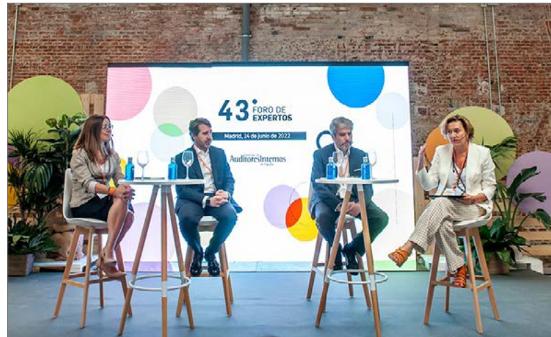
Foro de Expertos