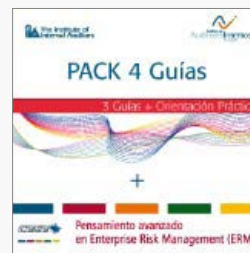
PACK 4 Guías