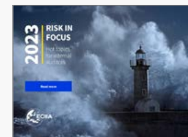
Risk in Focus