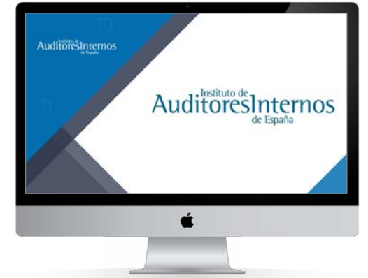
Los Lunes del Instituto