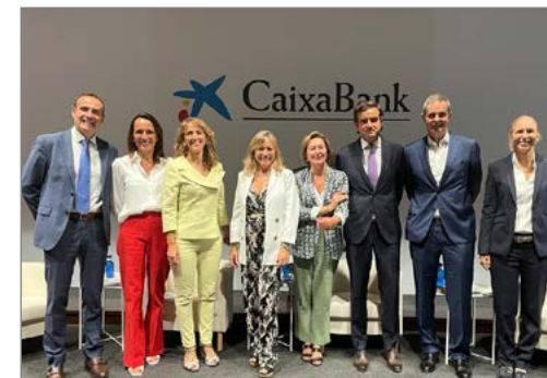
Día del Auditor Interno en Barcelona