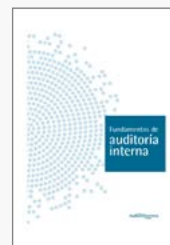
Fundamentos de auditoría interna