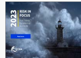
Risk in Focus