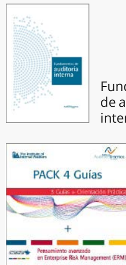
Fundamentos de auditoría interna