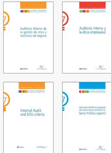
Laboratorio de ideas